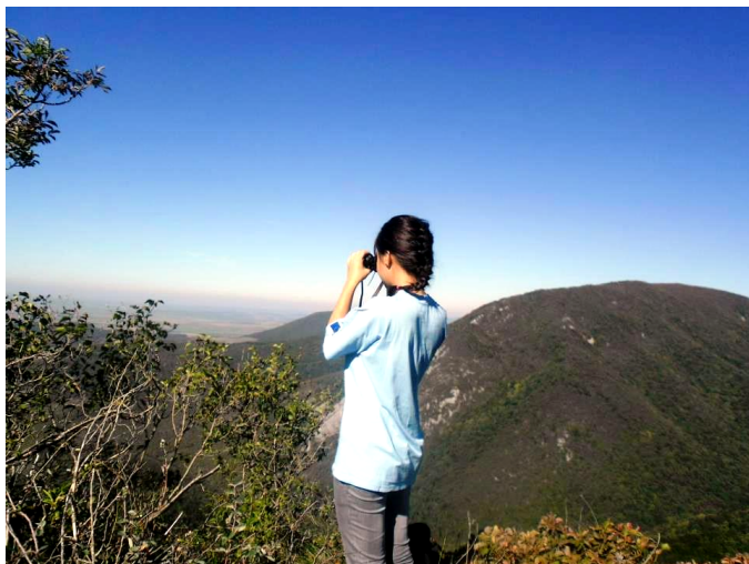
Sus pe Piatra Rolului, aproape de cer.

înfațșări atunci când este privită venind în zonă dinspre Timișoara, Moldova Nouă sau Socolari.