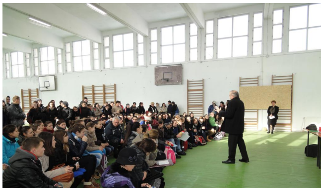
Lansarea anului de voluntariat 2013 la Moldova Nouă

Grupul Ecologic de Colaborare Nera implementează în fiecare an, în perioada aprilie - noiembrie, proiectul de interes public „Voluntariat pentru protejarea lumii mirifice din sudul Banatului” destinat prestării unor activități ce vizează îmbunătățirea stării factorilor de mediu, biodiversității și ecoturismului în zona ariilor naturale protejate din Parcul Natural Porțile de Fier, Parcul Național Cheile Nerei - Beușnița, Parcul Național Semenic Cheile - Carașului, Parcul Național Đerdap, Rezervația Naturală Specială Deliblatska Peščara (Dunele Deliblata) și Parcul Natural Regional Vršacke Planine