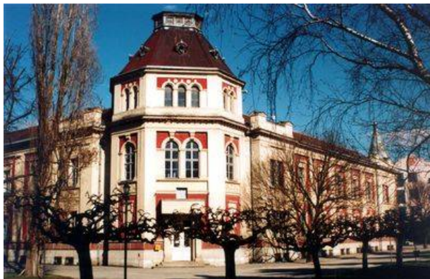
Clădirea Consiliului Local din Veliko Gradište

Aici sunt amenajate plaje și zone de agrement pe lățimi de 28 m. În vestitul complex turistic Beli Bagrem își petrec weekend-ul atât localnicii, cât și turiștii veniți din alte zone ale țării și din România.