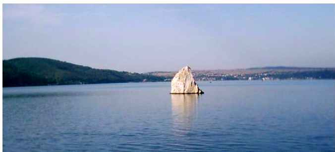
Stanca Baba Caia - crăiasa tăcută a Dunării.

Dunărea formează limita sudică a județului Caraș-Severin, pe o lungime de 60 km, al cărei debit la Baziaș - localitatea în care intră pe teritoriul României - este de 5400 mc/s. Fluviul Dunărea are o lungime de 2857 km, o suprafață a bazinului de 817000 kmp și un debit mediu anual de 6500 mc/s. Cursul străbate teritoriul a 11 țări și traversează 8 state, parcurgând 3 din capitalele acestora, fiind singurul fluviu internațional al Europei. Dunărea are 45 de afluenți importanți, iar din totalul de 120, - 34 sunt navigabili.